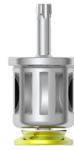
Unigrip 9 mm