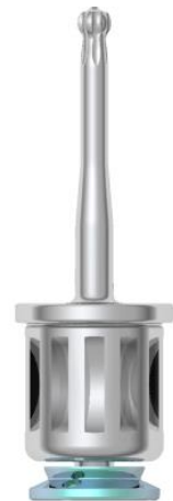
Fori Inclinati 15 mm