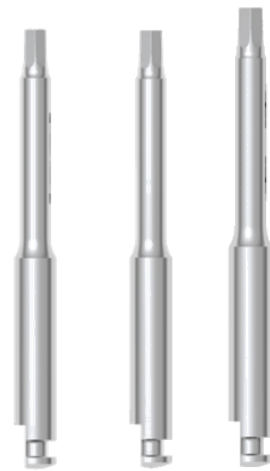
Esagonale 16 mm