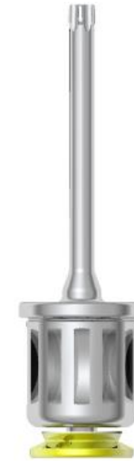
Unigrip 15 mm