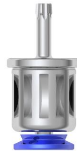
Torx® 6 mm