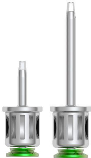
Esag.Conico 9 mm